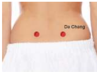
Da Chang Yu

Судороги икроножных мышц (спазмы икроножных мышц), усталость ног, коленная усталость, запоры, боли в пояснице, ломота в пояснице, выпадение прямой кишки, геморрой. Эти PT относятся к одним из важных точек на человеческом теле через которые проходит меридиан мочевого пузыря.