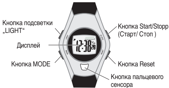
Вид на пульсоксиметр спереди