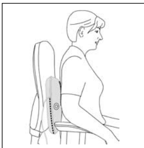
Массаж спины: нижняя часть спины (поясничный отдел позвоночника)